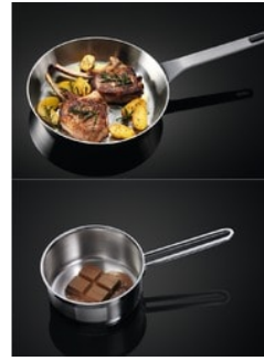
Präzise Kontrolle durch TouchControl